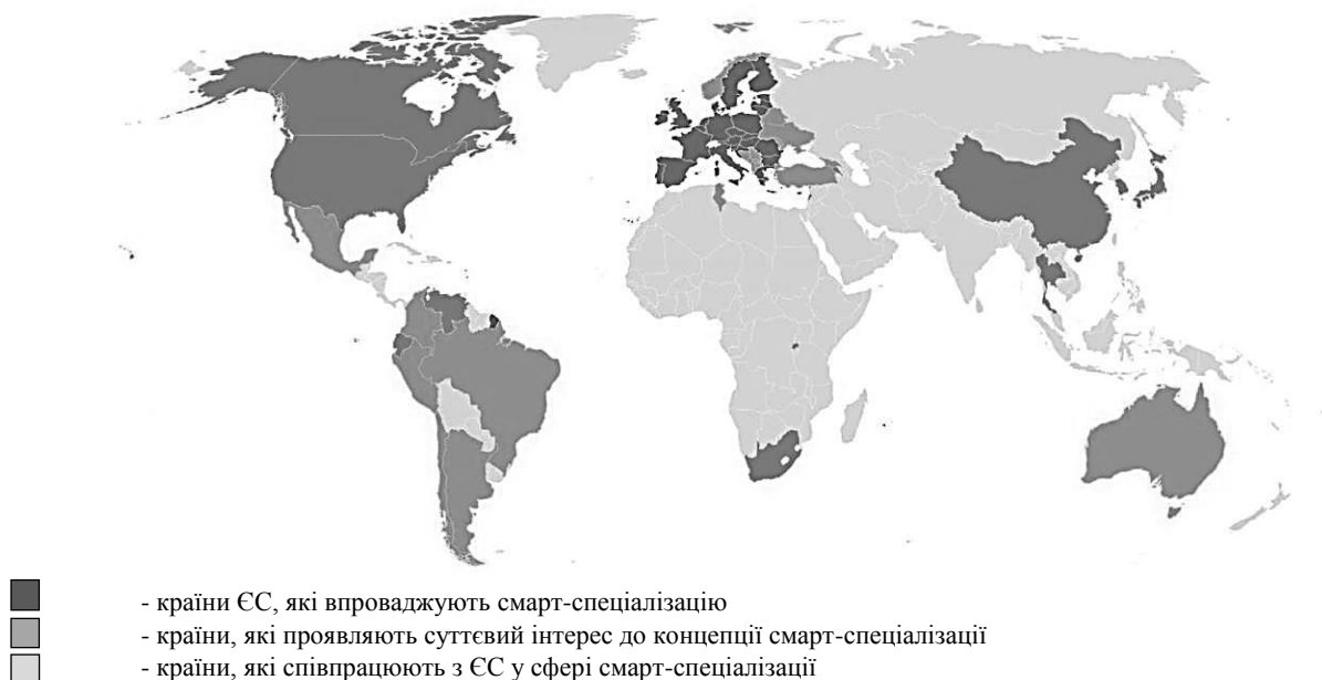
Рис. 1. Досвід впровадження смарт-спеціалізації у світі

Виклад основних результатів та їх обґрунтування. Впровадження концепції саміт-спеціалізації або її окремих елементів сьогодні спостерігається не лише у країнах ЄС, а й на різних етапах в Австралії, Бразилії, Колумбії, Мексиці, Перу, Норвегії та Чилі. Інтерес до смарт-спеціалізації проявляє влада Китаю, Таїланду, країн Африки, США та Канади. Рівень зацікавленості варіюється від діалогу на ранній стадії (Венесуела, Вірменія, Еквадор, Канада, Китай, Ліван, ПАР, Південна Корея, Руанда, США, Таїланд, Японія) до перших кроків щодо співробітництва (Аргентина, Білорусь, Боснія і Герцеговина, Грузія, Колумбія, Перу, Чилі) [8]. Серед таких країн і Україна (рис. 1).