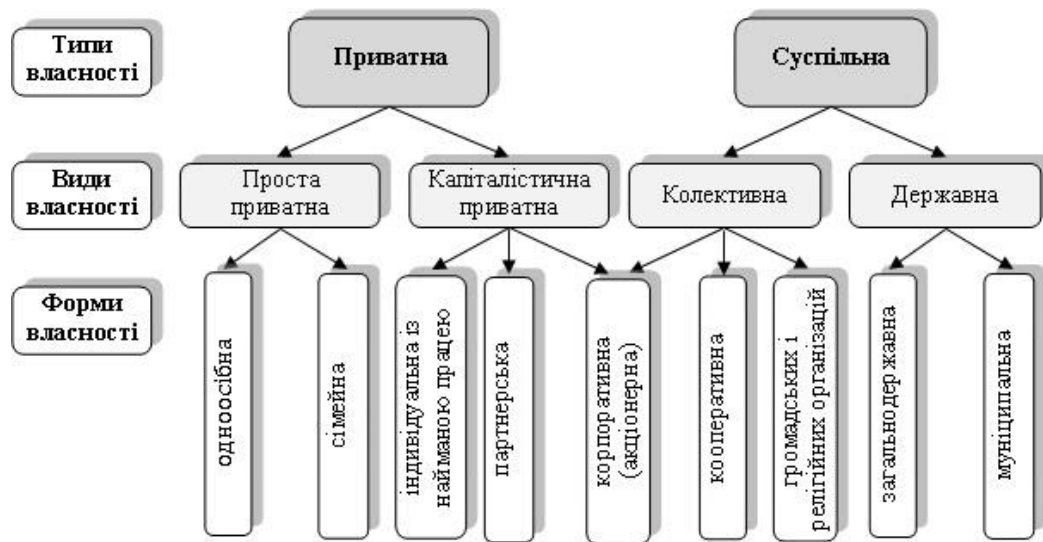
Рис. 1. Класична класифікація типів, видів і форм власності