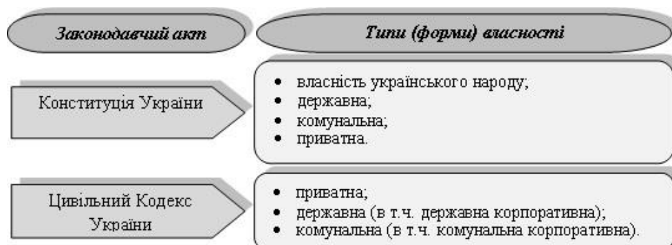
Рис. 3. Класифікація власності за законодавством України

Класифікацію власності відповідно до законодавства України наведено на рисунку 3.